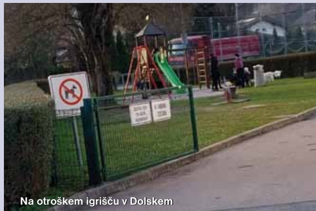
Na otroškem igrišču v Dolskem