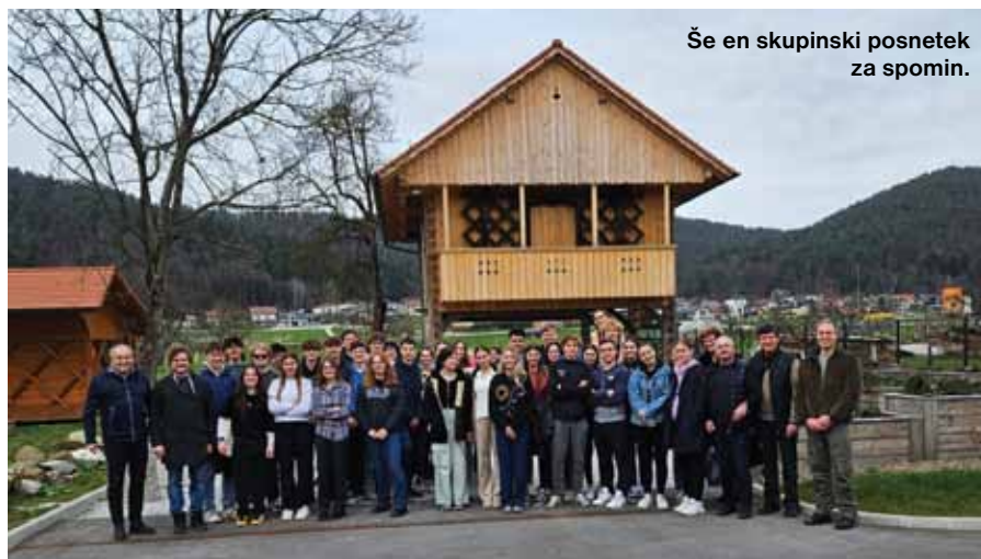
Še en skupinski posnetek za spomin.