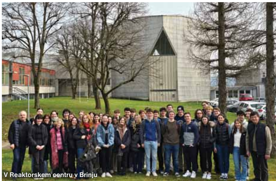
V Reaktorskem centru v Brinju

mno pomemben povezovalni člen med Slovenijo in Avstrijo, saj se je leta 1754 rodil na območju sedanje Republike Slovenije, živel, ustvarjal in leta 1802 pa umrl na Dunaju, kjer je tudi dočakal baronsko čast. Predstavitev Občine Dol pri Ljubljani je bila uresničena 30. 9. 2004 zvečer v kulturnem centru koroških Slovencev Haček v Celovcu. Številčna delegacija Občine Dol pri Ljubljani, ki je predsta-