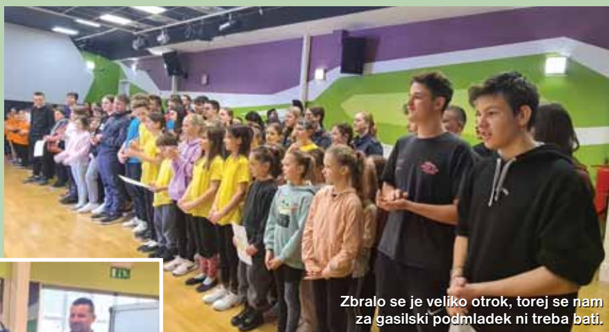
Zbralo se je veliko otrok, torej se nam za gasilski podmladek ni treba bati.