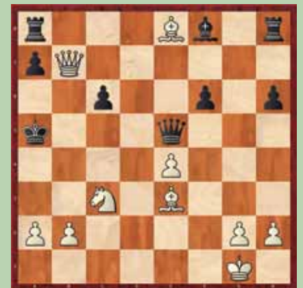
Primer 3: beli na potezi; mat v treh potezah.