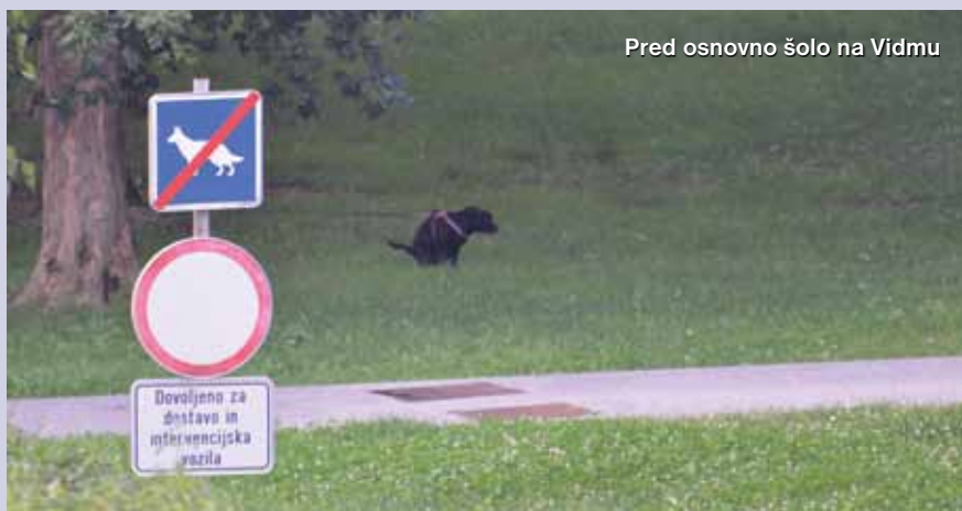
Pred osnovno šolo na Vidmu

1b Opažamo, da se kljub tabli, ki označuje, da je sprehajanje psov v okolici osnovne šole prepovedano, nekateri lastniki pasjih ljubljencev odločijo za sprehod ob šoli, njihovim ljubljencev pa pri tem pustijo, da se olajšajo ob vogalih in na šolskih zelenicah. Kaj lahko še storite, lahko na kakšen način to preprečite, morda z dodatnimi opozorilnimi