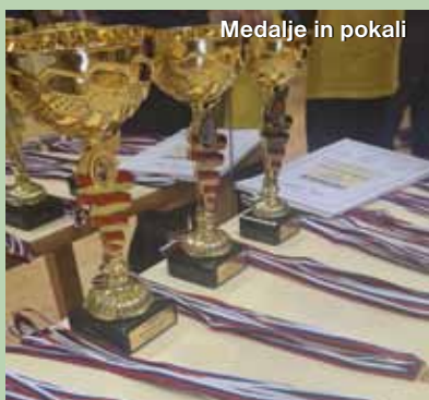
Medalje in pokali