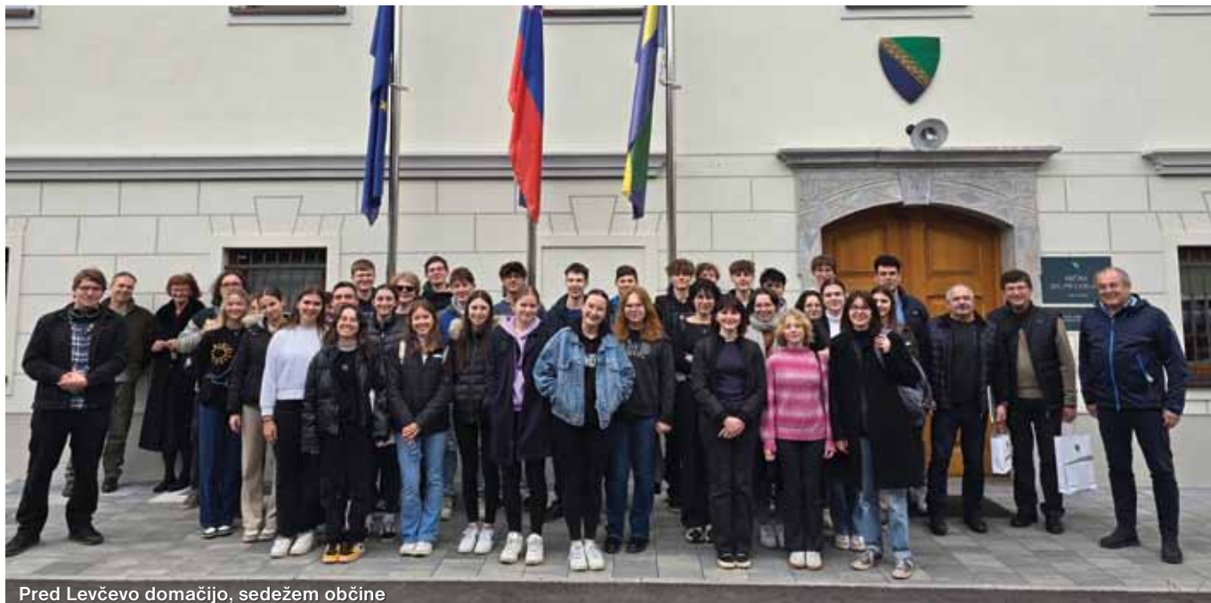
Pred Levčevo domačijo, sedežem občine

Leta 2002 je minilo 200 let od nesrečne in prezgodnje smrti našega znamenitega rojaka Jurija Vege.