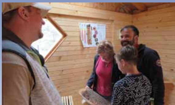
Čebelarsko društvo Dolsko, ki skrbi za Levčev čebelnjak na domačiji, je obiskovalcem predstavljal svet čebel.