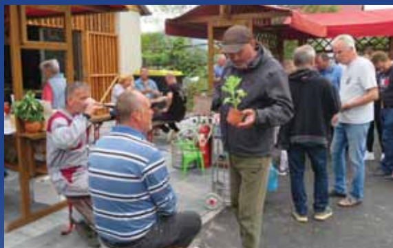
Prijetno sejmsko vzdušje – priložnost za nakupe, srečanja in klepet.