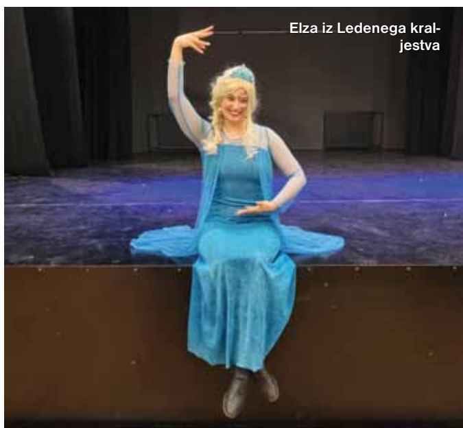
Elza iz Ledenega kraljestva