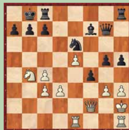
Primer 3: beli na potezi; mat v 5.