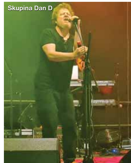
Skupina Dan D