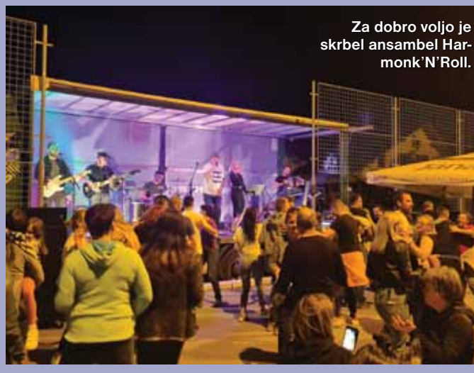
Za dobro voljo je skrbel ansambel Harmonk'N'Roll.