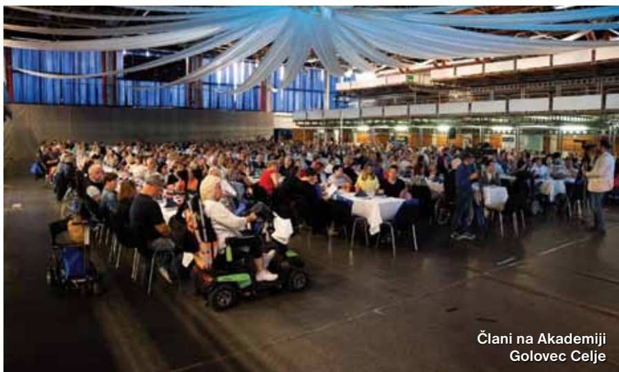
Člani na Akademiji Golovec Celje

27. maja je v celjski dvorani Golovec potekala slavnostna akademija ob 50. obletnici delovanja Združenja multiple skleroze Slovenije in svetovnem dnevu multiple skleroze.