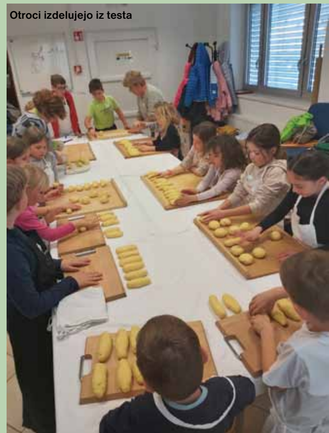
Otroci izdelujejo iz testa