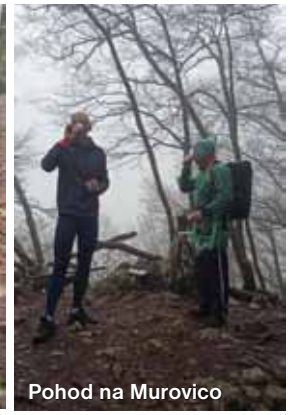
Pohod na Murovico