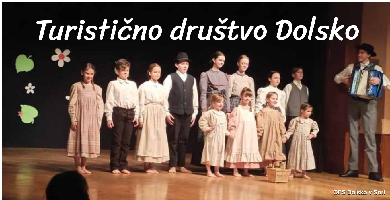
OFS Dolsko v Sori

Turistično društvo Dolsko je imelo v prvih mesecih v tega letu polne roke dela.