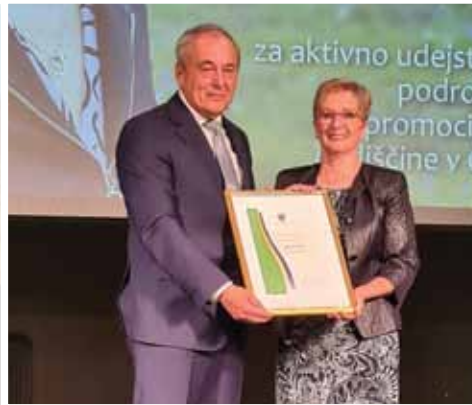
Dobitnica priznanja župana Zlatka Tičar