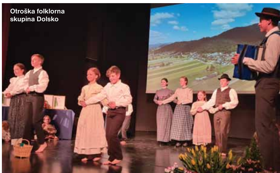
Otroška folklorna skupina Dolsko