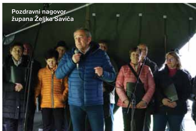
Pozdravni nagovor župana Željka Saviča