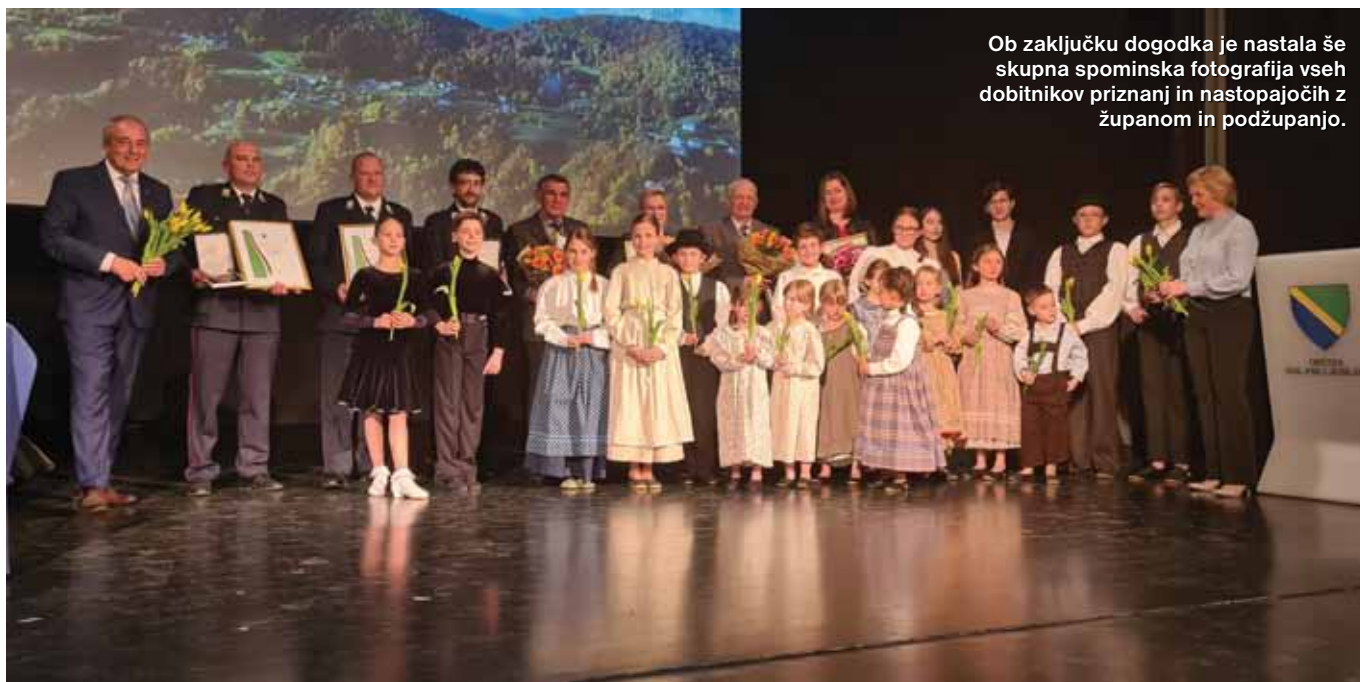
Ob zaključku dogodka je nastala še skupna spominska fotografija vseh dobitnikov priznanj in nastopajočih z županom in podžupanjo.