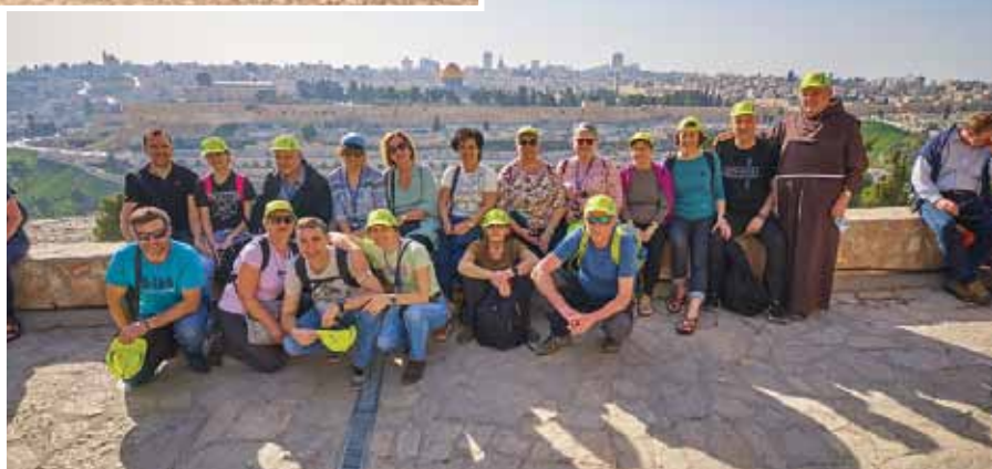
Jeruzalem v ozadju

Predzadnji dan smo se napotili na jug do najstarejšega mesta Jeriho in naprej do Mrtvega morja, ki leži na