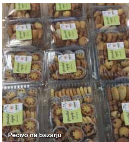
Pecivo na bazarju