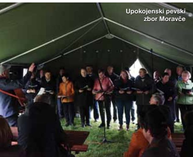
Upokojenski pevski zbor Moravče