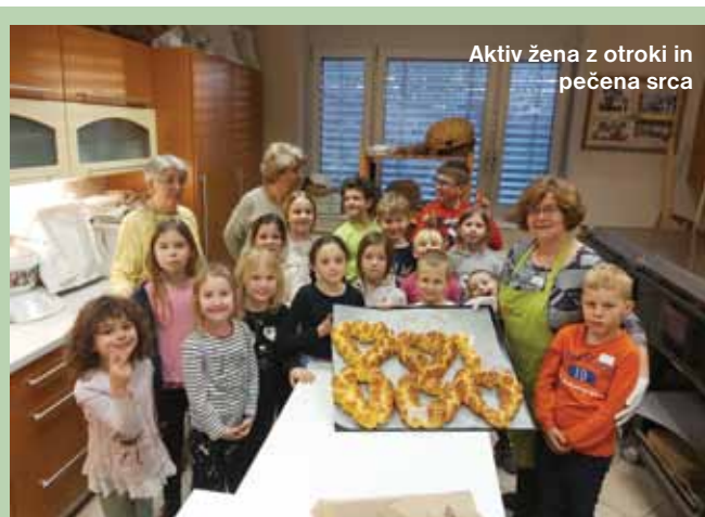
Aktiv žena z otroki in pečena srca