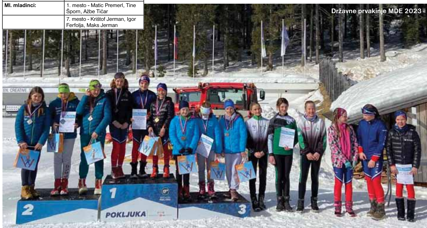
Državne prvakinja MDE 2023