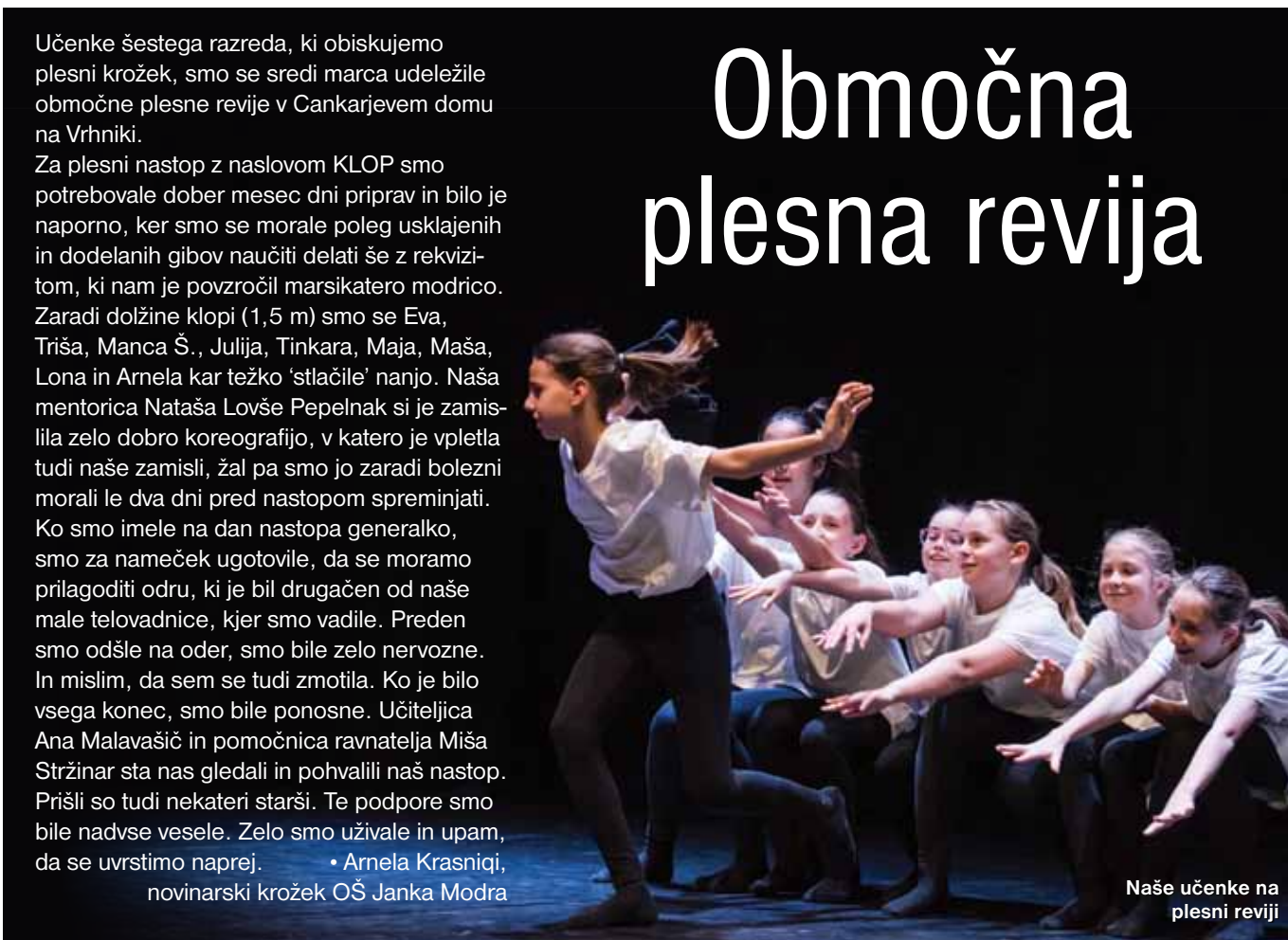
Naše učenke na plesni reviji