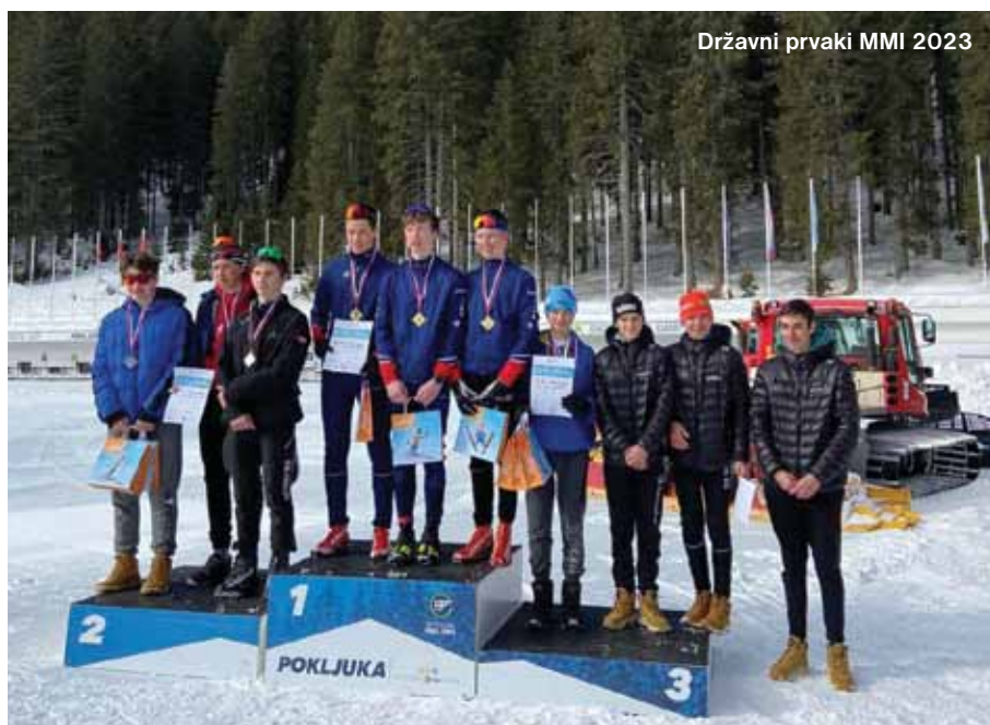
Državni prvaki MMI 2023