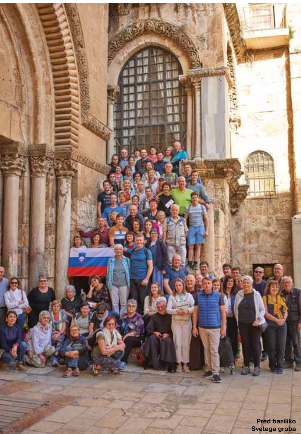
Pred baziliko Svetega groba