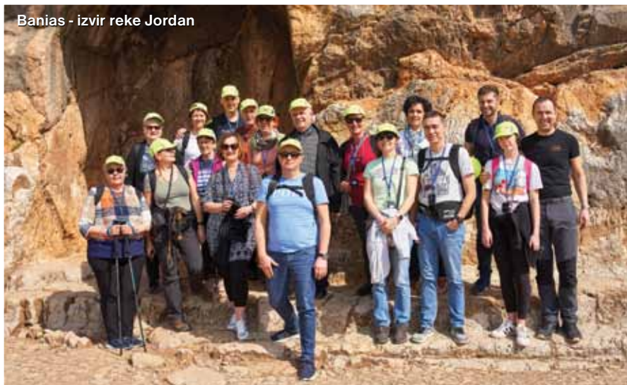
Banias - izvir reke Jordan

globini -430 metrov. Morje je desetkrat bolj slano, saj vsebuje 34 odstotkov soli. Med kopanjem oziroma lebdjenjem smo se zelo zabavali. Pravijo, da je blato morja zdravilno, zato smo se z njim vsi dobro namazali.