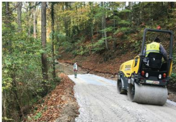
je prikazana sanacija odseka ceste v Vinjah.

Popise za izvedbo sanacij in popis stanja cest je Občina izvedla v lastni režiji, nato pa je objavila javni razpis ter na podlagi tega izbrala izvajalca. V sklopu omenjenih sanacij se na cestah pojavljajo naslednje zapore: dve polovični zapori v Beričevem, polovična zapora na odseku v Lazah, popolna zapora in delna zapora na dveh odsekih v Vinjah ter popolna premočna zapora v Senožetih.