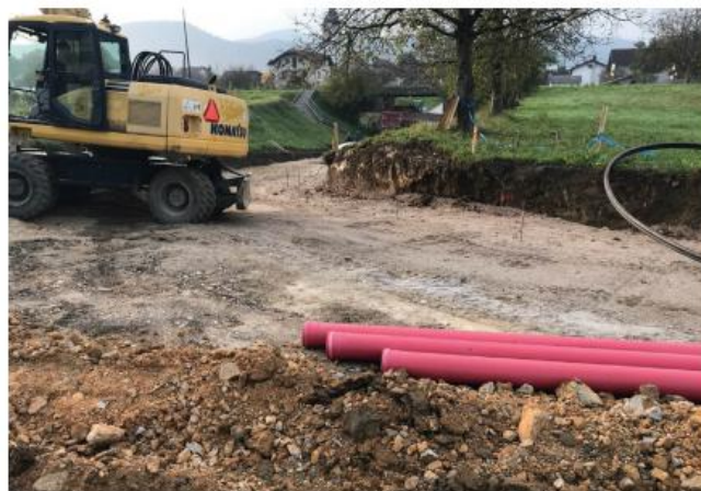
za mešani promet ter izvedbo rolkarske steze.

Natančne lokacije si lahko ogledate na spletni strani www.dol.si . Zaključek del je predviden do konca novembra, odvisen pa je predvsem od vremenskih razmer. Na fotografiji na levi