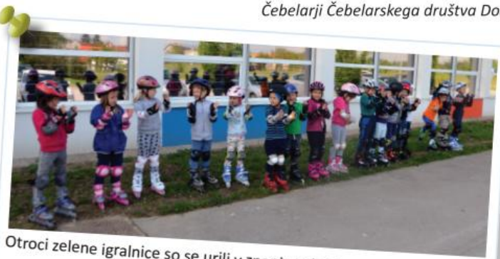
Otroci zelene igralnice so se urili v znanju rolanja.