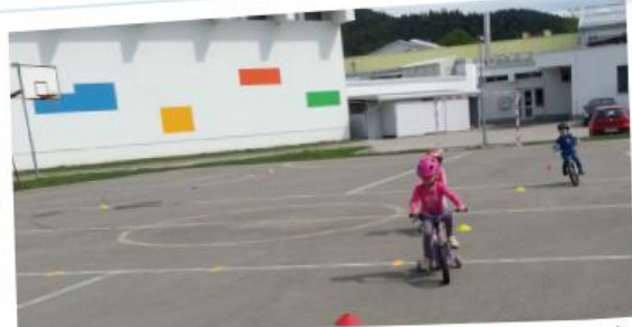
Otroci rdeče igralnice pri preizkušanju kolesarskega znanja. Melita Petrič