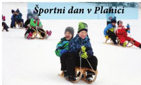
Športni dan v Planici