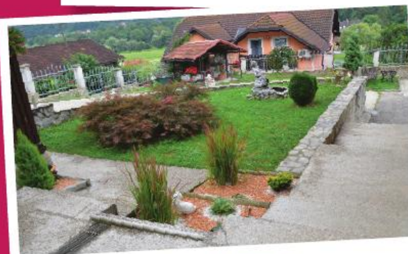
2. mesto: Dragica Novak, Senožeti