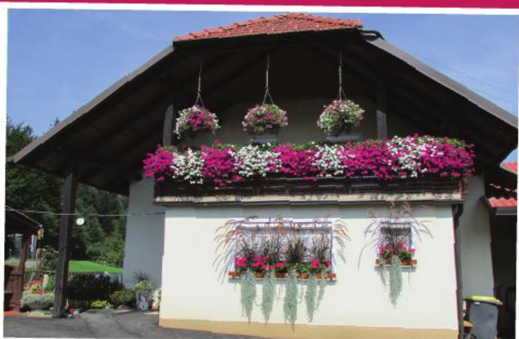
1. mesto: Irenka Zavrl, Kamnica