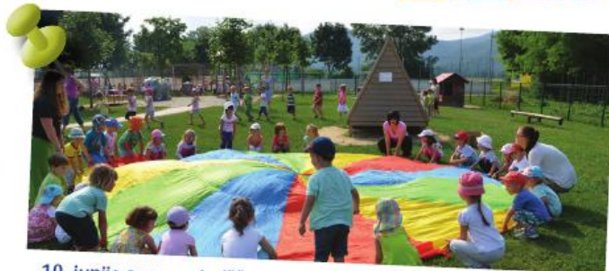
10. junija smo na igrišču vrtca Dol zaključili športni program Mali sonček. Otroci so gibalno sodelovali v različnih športnih igrah. Ob zaključku smo zapeli in zaplesali ter prejeli zaslužena priznanja.