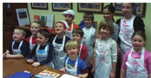
MLADI LJUBITELJI KUHANJA Plamenčki se pod mentorstvom aktiva žena Plamen učijo novih vrlin. Njihova srečanja potekajo enkrat mesečno v KD Dolsko.