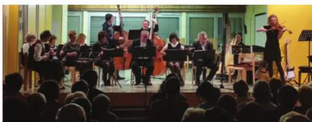
Senožeški tamburaški orkester na obisku v Brezovici