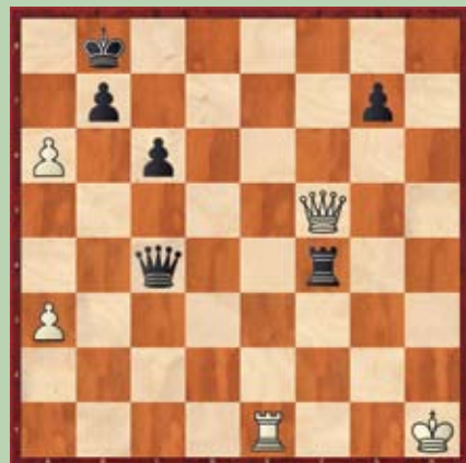
Primer 1: beli na potezi; črni se preda v šesti potezi.

Vabljeni, da se preizkusite v vaših šahovskih sposobnostih. V vsaki številki se spoprijemamo s tremi šahovskimi problemi, ki so razvrščeni po težavnosti. Ob vsaki šahovski poziciji je na voljo tudi kratek opis problema. Rešitve ugank bodo objavljene v naslednji številki. Veliko uspeha pri reševanju!