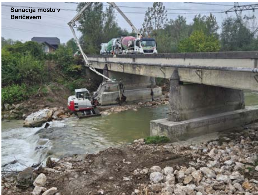
Sanacija mostu v Beričevem

Kot zelo uporaben se je izkazal tudi večnamenski prostor pri stavbi občine, saj je bilo na njem izpeljanih sedem večjih dogodkov. Dobro so bili sprejeti in doživeli so velik odziv. Pokazale so se le manjše pomanjkljivosti glede prometne ureditve, predvsem mislim tu na del ceste ob občinski stavbi, kjer avtomobili neustrezno parkirajo. Poskusili bomo razširiti parkirišče v smeri proti paviljonom in v smeri povezovalne ceste na Zasavsko cesto.