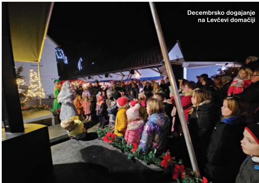
Decembrsko dogajanje na Levčevi domačiji

skrbela za postavitev električnih polnilnic na najmanj sedmih lokacijah v občini. V prvi fazi bodo izbrane lokacije pri zdravstveni ambulanti v Dolu, Kulturnem domu v Dolskem, Železniški postaji Laze, parkirišču pri šoli na Vidmu in v Senožetih ter na avtobusnem postajališču v Beričevem. Ena pa je že na lokaciji Občine Dol.