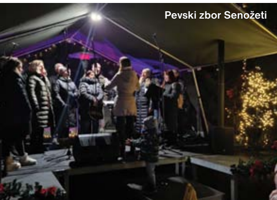
Pevski zbor Senožeti