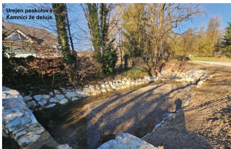
Urejen peskolov v Kamnici že deluje.