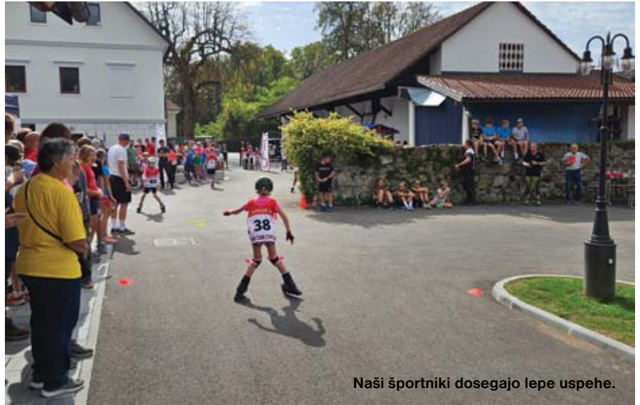
Naši športniki dosegajo lepe uspehe.

Minulo programsko obdobje smo bili kar učinkoviti. Uspešni smo bili pri izvedbi osmih projektov, ki so tudi vključeni v program dela društev ali posameznikov. V novi perspektivi bomo te projekte poskušali še nadgrajevati, iskali pa bomo tudi nove vsebine, ki bi dodatno obogatile naše kraje. Želimo si nove perspektive v obdobju od 2024 do 2027, ko se bomo zelo aktivno vključevali. Predvsem na področjih povečanja so-