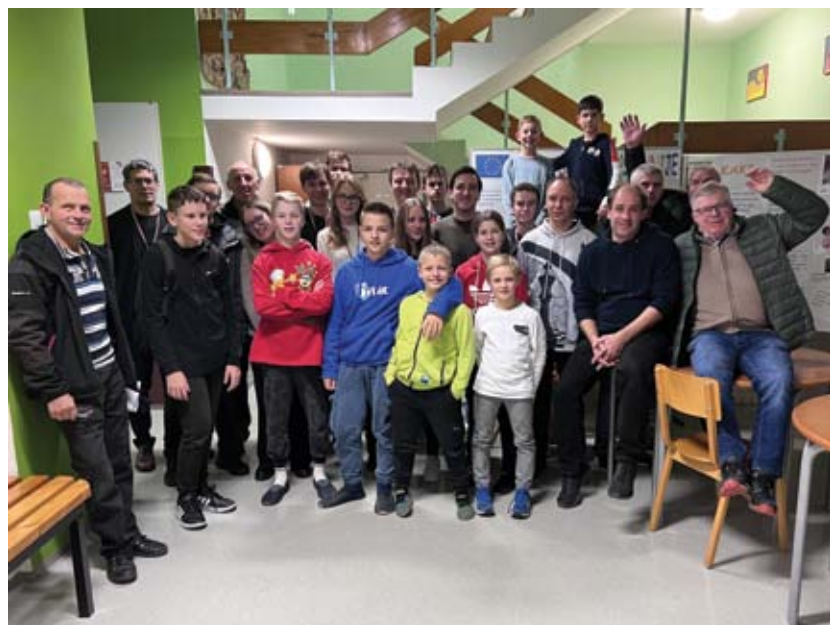
Udeleženci občinskega prvenstva.