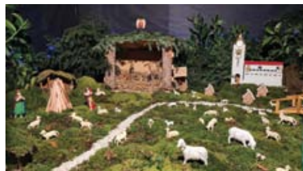
Na ogled so bila tudi tradicionalne jaslice družine Kralj, ki so jih letos postavili domači skavti.