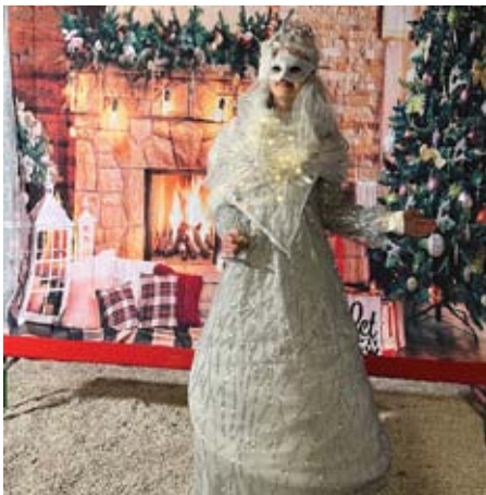
Snežna kraljica je razveselila otroke.