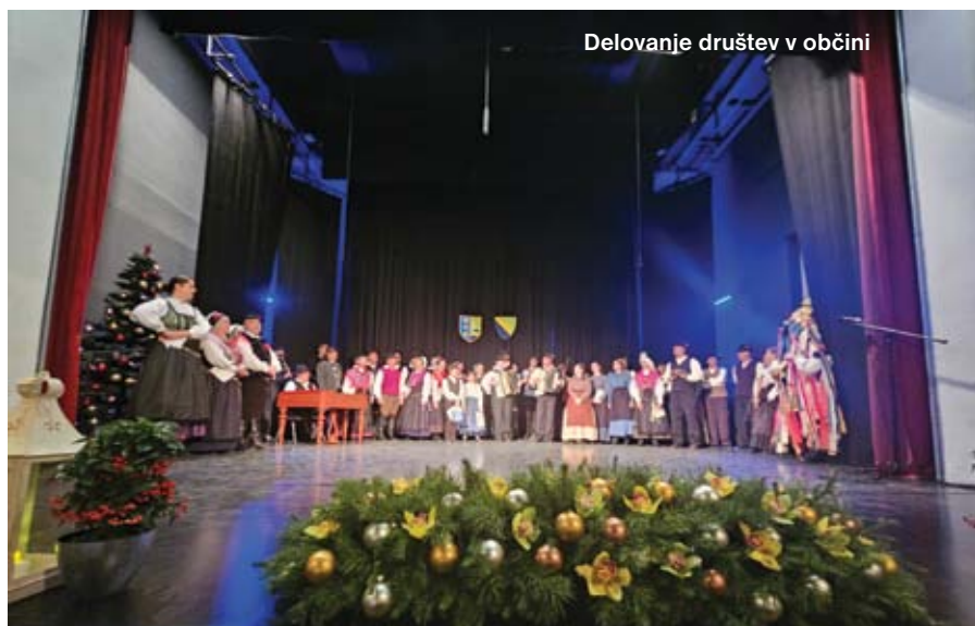
Delovanje društev v občini

Veseli smo, da smo izbrali ustreznega izvajalca teh dogodkov na Levčevi domačiji, ki je za izvedbo namenil dva konca tedna in en dan izvedbi božične zgodbe. Vsebinsko so bili dogodki zelo močno podprti, žal pa glede na to, da je to nova stvar, ni bilo pričakovano večjega obiska. To je verjetno tudi posledica povezanih