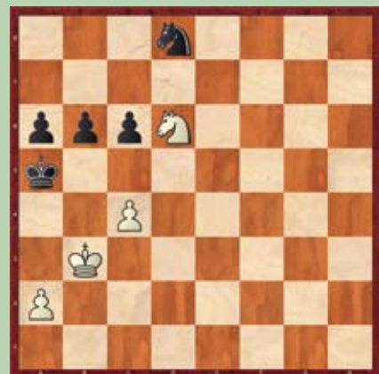
Primer 3: beli na potezi; črni se preda v prvi potezi.