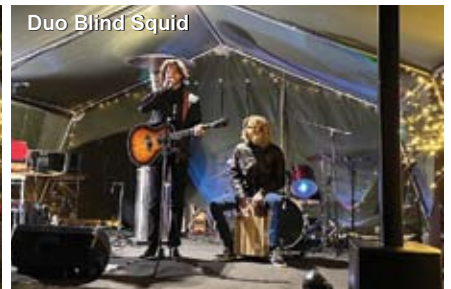
Duo Blind Squid