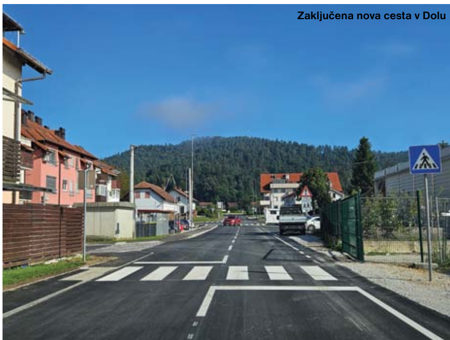
Zaključena nova cesta v Dolu

Že v prejšnjem mandatu smo stavbe v lasti Občine Dol uredili energetsko varčne tako, da smo vse toplotne naprave na kurilo olje zamenjali s plinskimi kotlovnici ali toplotnimi črpalkami. Sami objekti občinskih stavb so bili na prvem pregledu ustreznosti ocenjeni kot neprimerni za na-