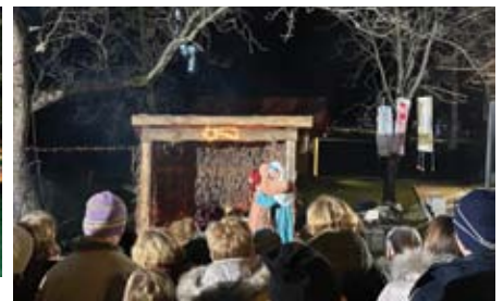
Žive jaslice so pritegnile množico gledalcev.