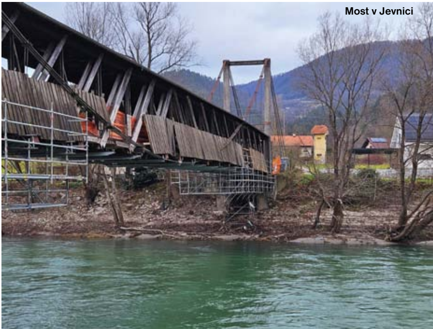
Most v Jevnici

imeli v načrtu že zadnji dve leti. Sem spada tudi izgradnja športne dvorane. Sočasno bomo pridobili tudi soglasje za gradnjo vaškega jedra Dola. S sprejemom novega prostorskega načrta v minulem letu smo bili tudi sami deležni dodatnega preverjanja in pridobivanja soglasij ministrstva za okolje, predvsem na področju poplavne ogroženosti, kjer so bile po novem upoštevane 500-letne poplavne vode.