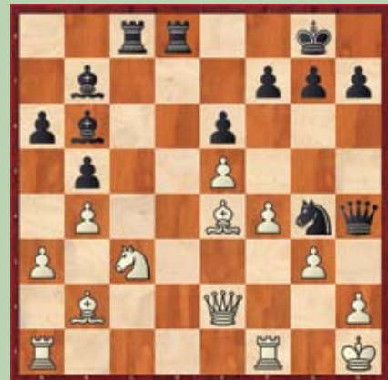
Primer 2: črni na potezi; beli se preda v peti potezi.