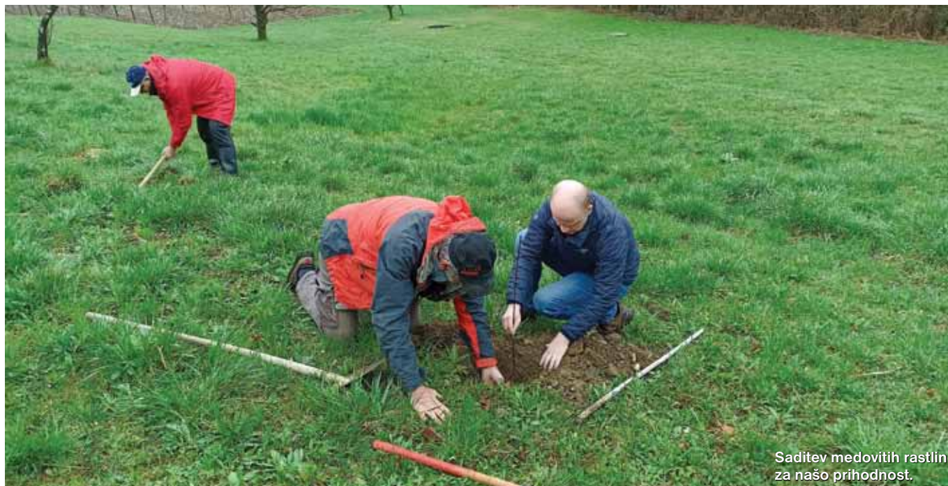
Saditev medovitih rastlin za našo prihodnost.

Čebelarji se zavedamo pomena ohranjanja okolja, saj vsaka večja sprememba vpliva na naše čebele in druge opraševalce. Zato smo se pri Čebelarški zvezi Slovenije odločili narediti korak naprej in prispevati k zmanjšanju negativnega vpliva na okolje. Letos, že tretje leto zapored bomo ozaveščali širšo javnost o pomenu sajenja medovitih rastlin s projektom Dan sajenja medovitih rastlin.