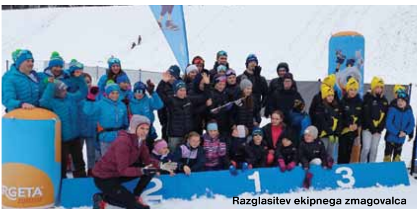
Razglasitev ekipnega zmagovalca