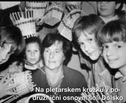
Na pletarskem krožku v podružnični osnovni šoli Dolsko