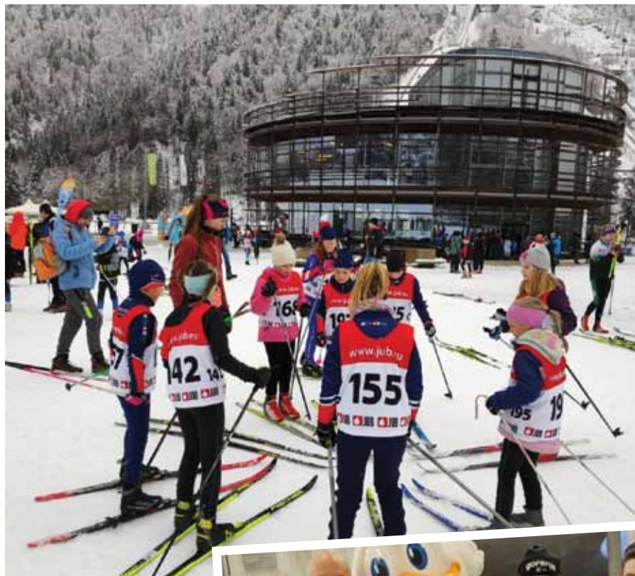
Najmlajši se pripravljajo na tekmovanje.

T ekmovanje je letos štel tudi za 'No border cup', ki ga Smučarska zveza Slovenije prireja skupaj z avstrijskimi in italijanskimi klubi. Tako je na tekmovanju, ki je potekalo v pravih zimskih razmerah, saj je ves čas snežilo, v klasični tehniki s posamičnim startom nastopilo kar 470 tekmovalcev iz 42 klubov iz 7 držav. Nastopili so tudi tekmovalci kluba iz Bariloč v Argentini, v katerem je velik pečat