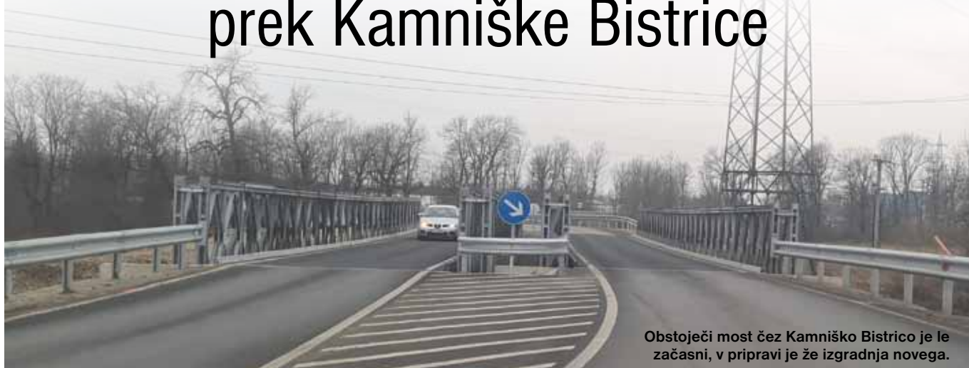
Obstoječi most čez Kamniško Bistrico je le začasni, v pripravi je že izgradnja novega.