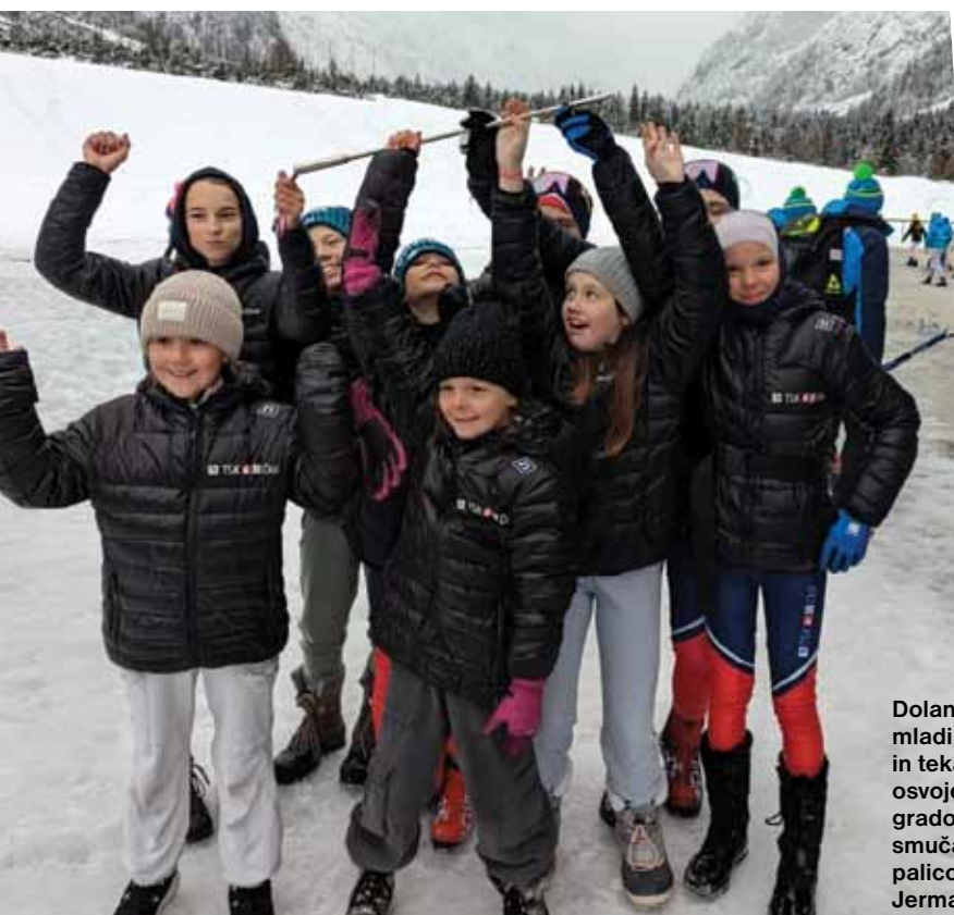
Dolanski mladi tekači in tekačice z osvojeno nagrado: Srebrno smučarsko palico Jožeta Jermana