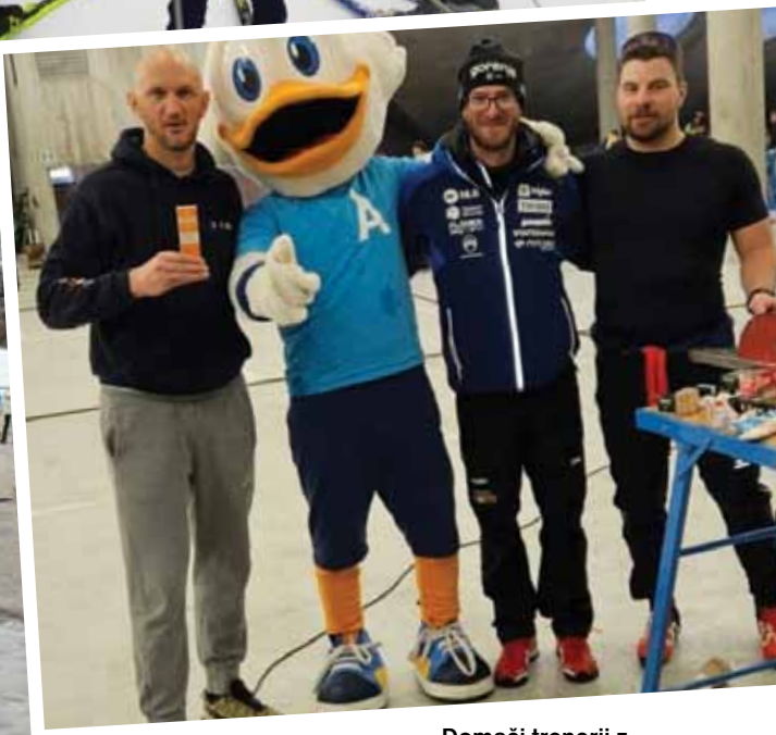
Domači trenerji z maskoto Argete