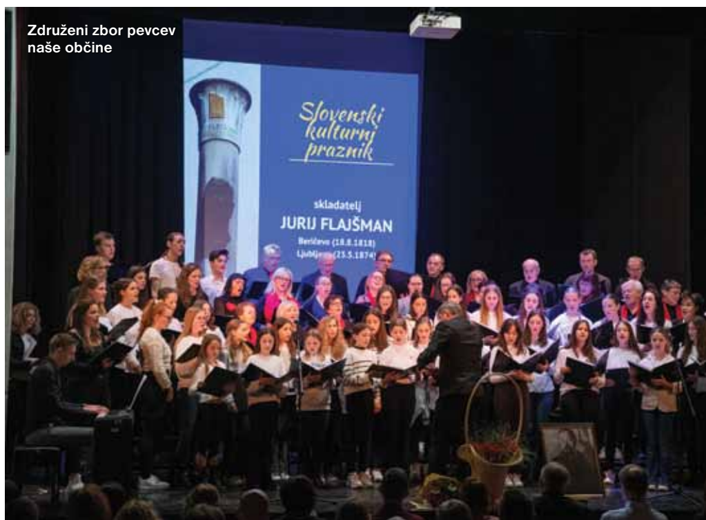
Združeni zbor pevcev naše občine