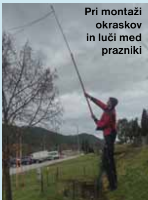
Pri montaži okrasov in luči med prazniki