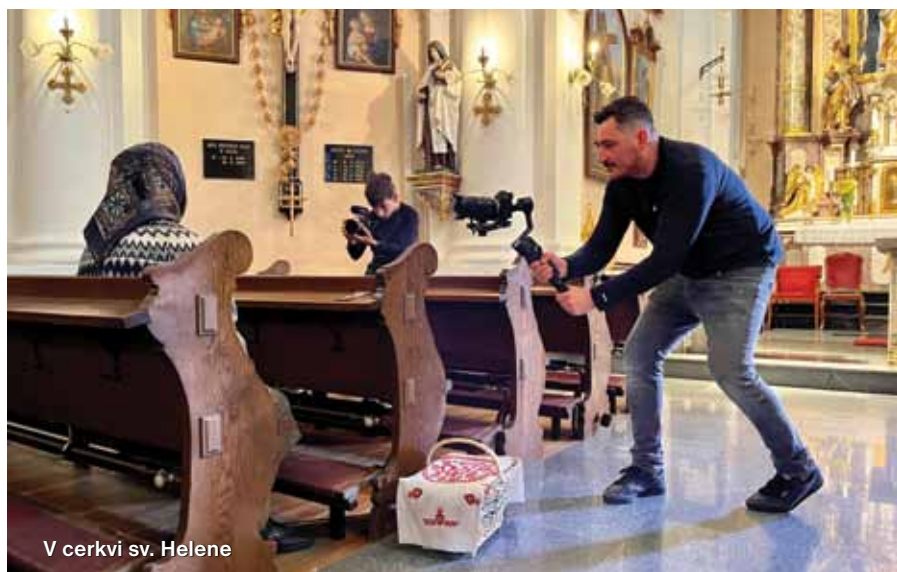
V cerkvi sv. Helene