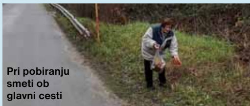
Pri pobiranju smeti ob glavni cesti