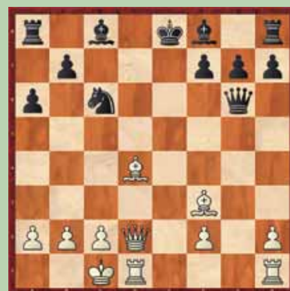
Primer 3: beli na potezi; mat v petih potezah.