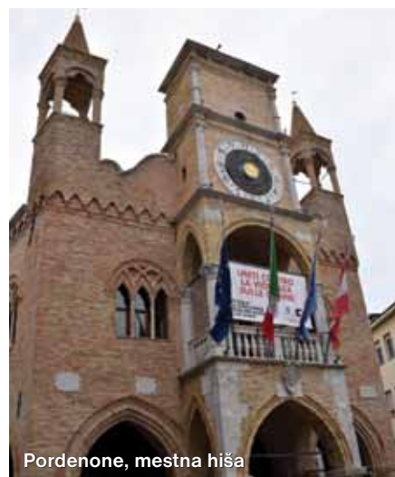
Pordenone, mestna hiša

Avtobus nas je že čakal, da nas popelje do mesteca Pordenone, ki ga opisujejo kot sodobno in živahno zaradi kulturnih prireditev. Vsako leto prirejajo tudi festival nemih filmov in cvetlično razstavo. Tu smo si ogledali mestno hišo z zvonikom.