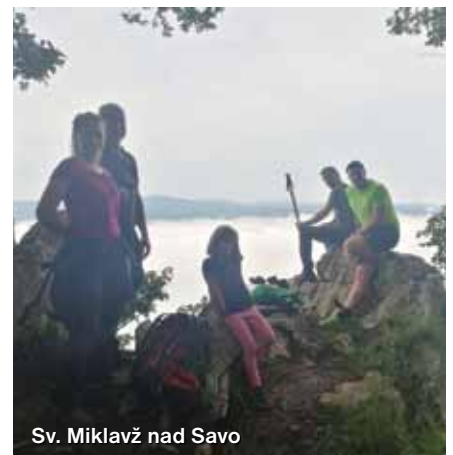
Sv. Miklavž nad Savo