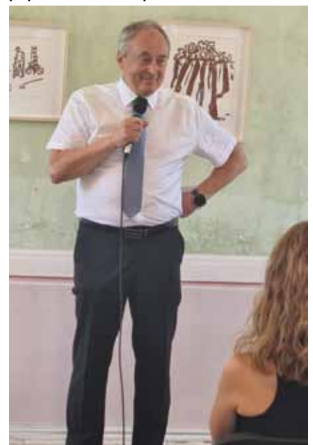
Župan je imel kratek govor, nato pa vsem 17 prejemnikom priznanj podelil županove petice.