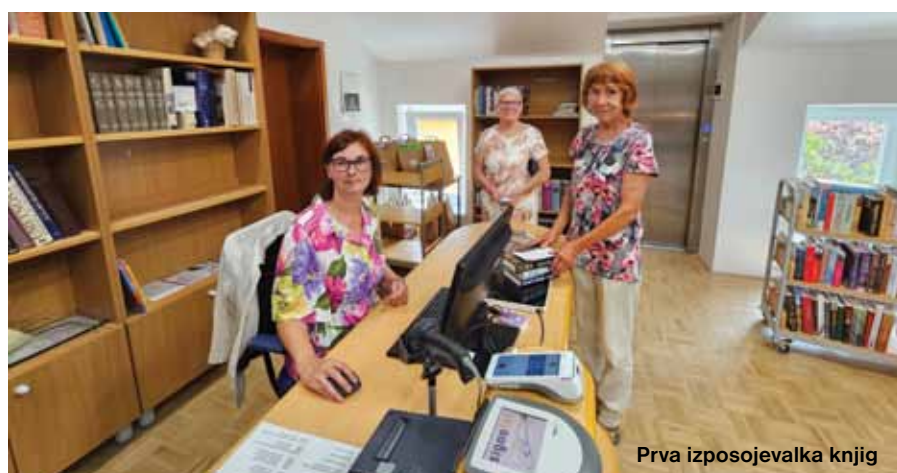
Prva izposojevalka knjig

diva. Če nimate časa za podrobno iskanje dobre literature in se vam mudi na dopust, počitnice, se prepustite izbiri knjižničark, ki so za vas pripravile vrečke Mački v žaklju z izbranimi knjigami, ki si jih lahko hitro izposodite. Izbor je premišljen in primeren za vse vrste bralcev – tako za odrasle kot tudi otroke.