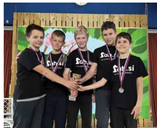
Tretji na državnem prvenstvu.