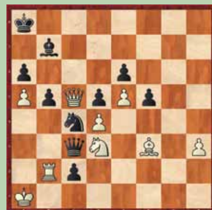
Primer 2: črni na potezi; mat v 3.