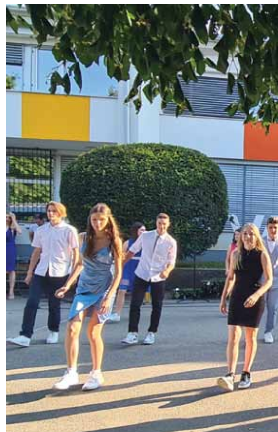
Valeta je potekala na šolskem dvorišču.

katerem sem prepričan, da smo vam pomagali, kolikor smo vam lahko.« Učenci so pokazali plesno znanje, vsak razred se je predstavil s svojo točko s petjem ali plesom. Ob uspešno zaključeni osnovni šoli so prejeli čestitke, najbolj pridni pa še kup priznanj. Za glasbeni vložek sta poskrbela Etno band in šolski band Janko Rocks, ob zaključku pa so učenci zaplesali še s svojimi starši, fantje z mami in dekleta z očetmi. •Nina Keder