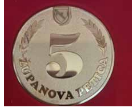
Priznanje je zapakirano v lično škatlico in bo učencem predstavljalo lep spomin.