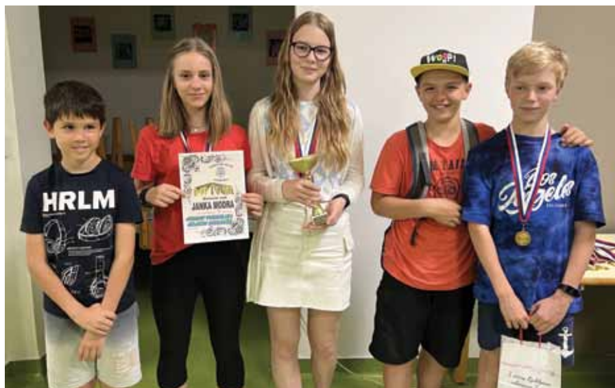
Zmagovalci ciklusa turnirjev mladih v razvrstitvi osnovnih šol.