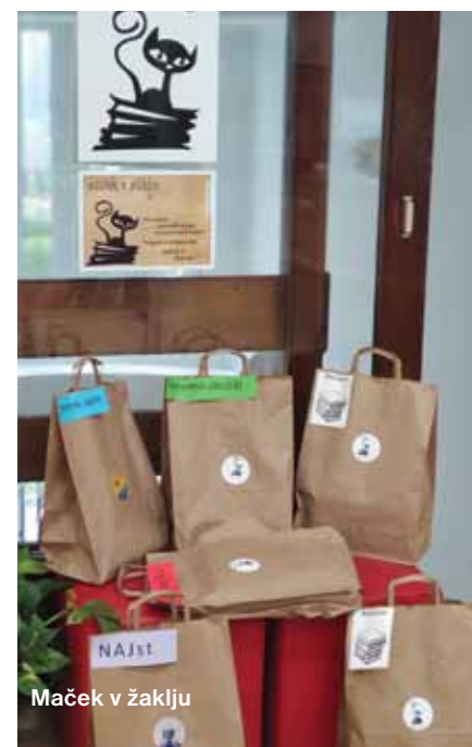
Maček v žaklju

priznanje ter sodelovali v nagradnem žrebanju.