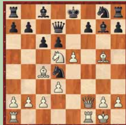
Primer 2: beli na potezi; mat v 4.