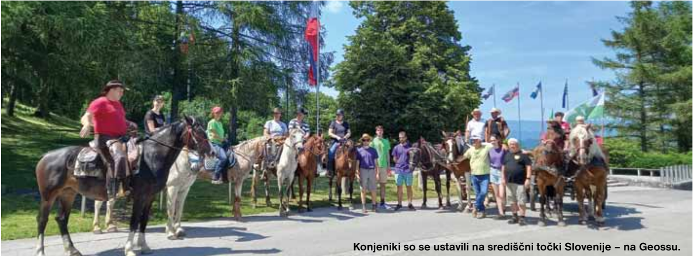
Konjeniki so se ustavili na središnji točki Slovenije – na Geossu.