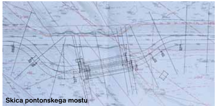
Skica pontonskega mostu