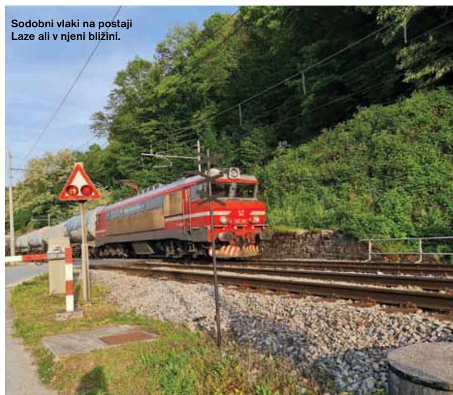
Sodobni vlaki na postaji Laze ali v njeni bližini.