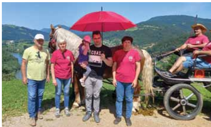
Na razgledni točki s predstavniki Društva prijateljev konj Višnja Gora