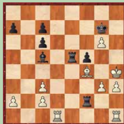
Primer 3: črni na potezi, beli preda v 2. potezi