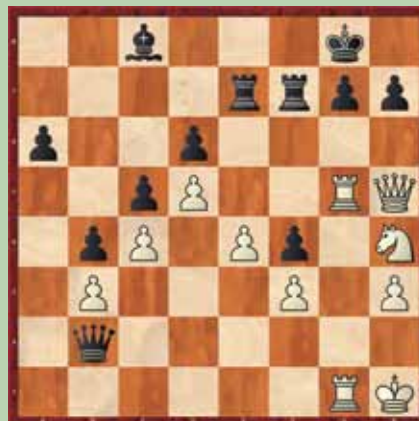
Primer 1: beli na potezi; črni preda v 3. potezi

Vabljeni, da se preizkusite v vaših šahovskih sposobnostih. V vsaki številki se spoprijemamo s tremi šahovskimi problemi, ki so razvrščeni po težavnosti. Ob vsaki šahovski poziciji je na voljo tudi kratek opis problema. Rešitve ugank bodo objavljene v naslednji številki. Veliko uspeha pri reševanju!