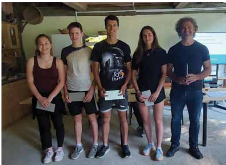
Nagrajeni tekmovalci v odraslih kategorijah

Po zaključku smučarske sezone so se člani kluba zbrali na tradicionalnem zaključku, ki je vedno združen z rednim občnim zborom in piknikom vseh aktivnih in podpornih članov kluba.