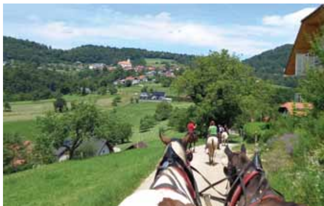
Pogled z vprege, v ozadju Vače

smrt, v povprečju pri 12 letih starosti. Bolezen je bila odkrita in potrjena v zelo zgodnji fazi, zahvaljujoč slovenskim zdravnikom porodničnice in pediatrične klinike, ki imajo zadnjih ne-