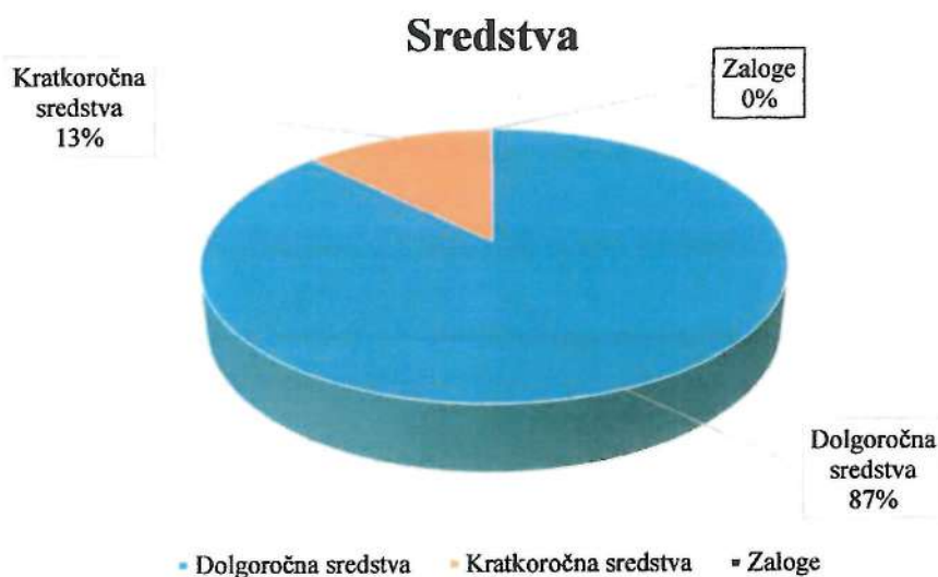
Slika 1: Grafični prikaz porazdelitve sredstev aktive